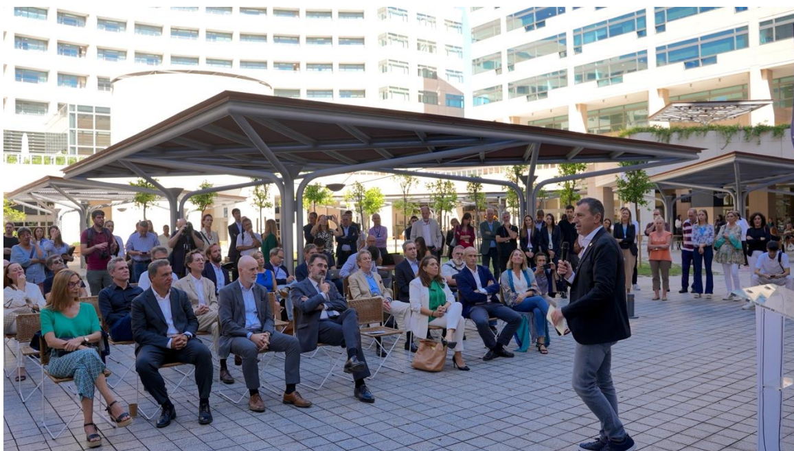
FOTO. La jornada també ha servit per inaugurar la nova plaça central del complex.