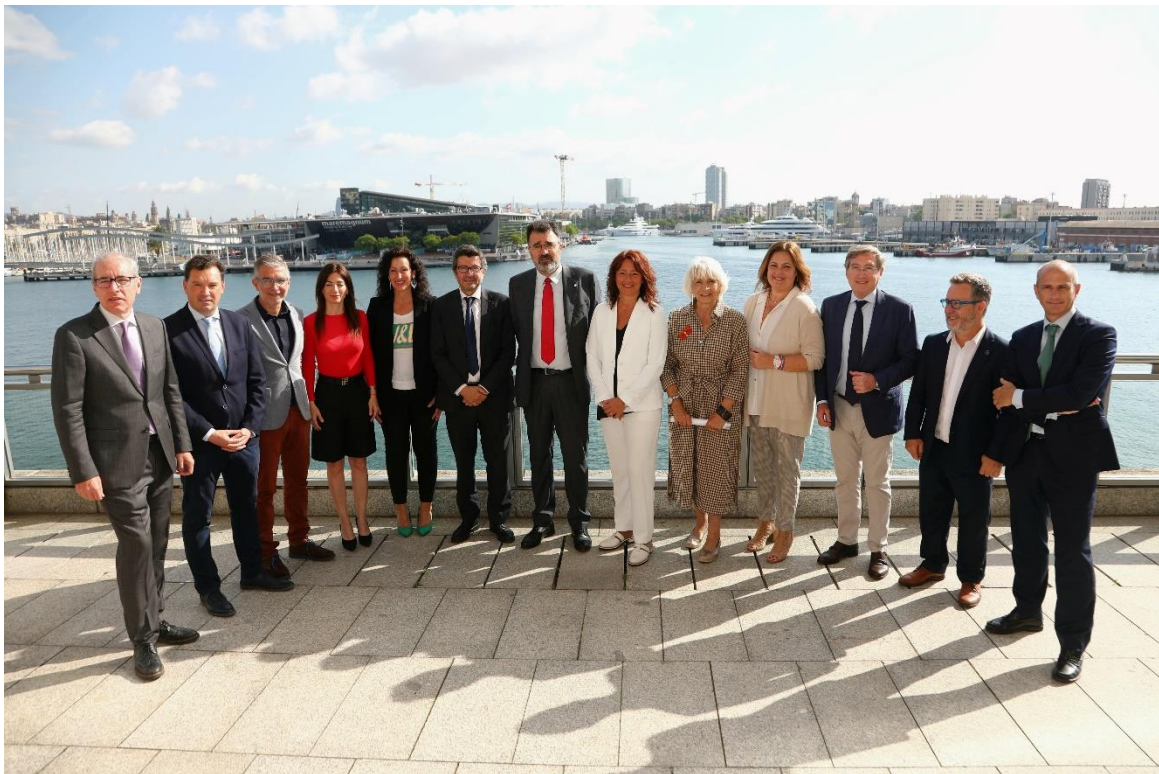
FOTO. 38º Encuentro RETE, celebrada este martes en el Port de Barcelona.