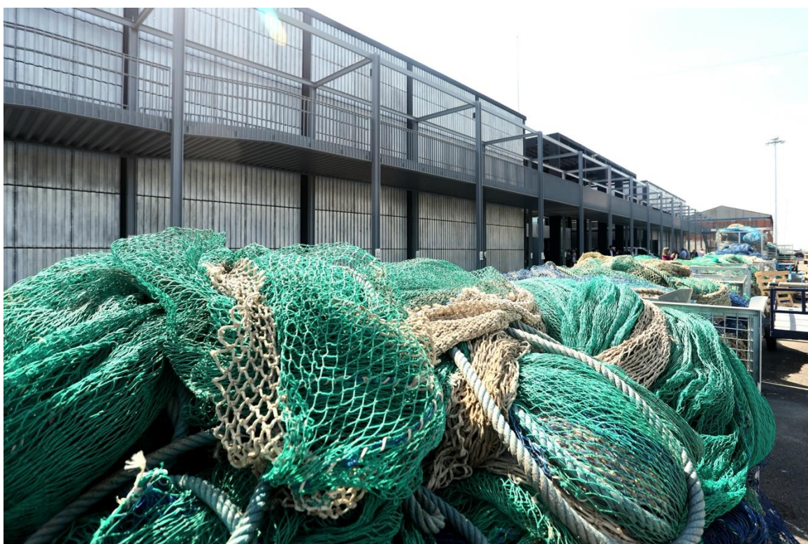
FOTO. El edificio de la nueva lonja incorpora una terraza perimetral que ofrece unas vistas privilegiadas de los puntos de atraque de los barcos de pescadores y su trabajo diario.