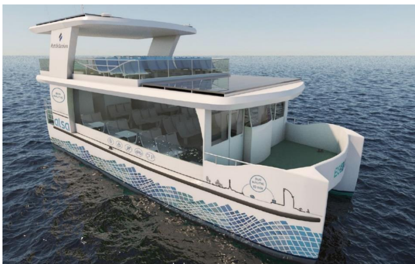
FOTO: Render d'una de les embarcacions que prestaran el servei de bus nàutic.

El punt aprovat avui pel Consell d'Administració és un pas important per desenvolupar el Pla de Transició Energètica del Port de Barcelona. La previsió és que la futura planta de combustible zero emissions generi nous tràfics marítims amb flotes de vaixells més nets i faciliti l'ús d'aquests nous combustibles en altres activitats portuàries i logístiques del port i de l'entorn.